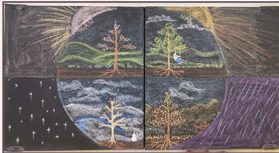
3. osztály táblarajz

A tavaszköszöntő hónapban a böjti időszak feléhez közeledünk, viszont hírlevelünkben nem böjtölünk, Szokásos tartalmainkat a 20. számban is megtalálhatjátok. Olvassátok szeretettel!